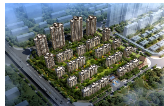
星洲湾项目效果图