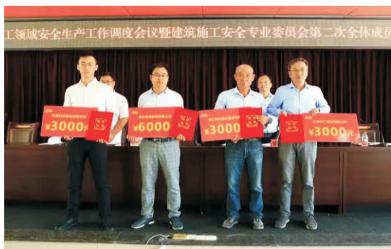
全南县安全生产工作会议暨建筑施工安全专业委员会第二次全体会议上，发达集团全南县员山小区项目部荣获“建筑安全生产标准化示范工地”称号。

本报讯 9月29日上午，在全南县住建局组织召开的全县建筑施工领域安全生产工作调度会议暨建筑施工安全专业委员会第二次全体会议上，发达集团全南县员山小区城市棚户区改造项目工程受到表彰，在全南县2019年度建筑施工安全生产