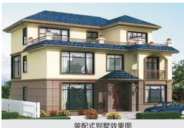
装配式别墅效果图