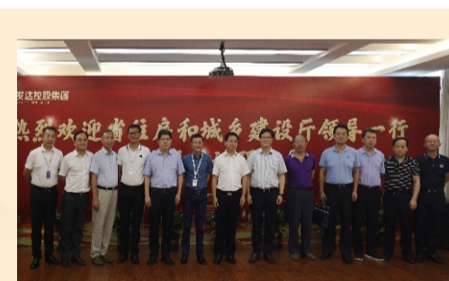
江西省住建厅厅长卢天锡一行 莅临发达集团调研