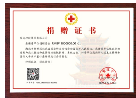
集团向湖北省红十字会捐赠100万元

乘着“云程发轫、达善天下”的企业使命，发达控股集团的高速发展同时没有忘记一个负责任的企业应当肩负的责任和担当，始终坚持不忘初心，牢记使命，积极投身于公益事业，参与产业扶贫、抗震救灾、抗洪抢险、捐资助学、慈善捐款等工作，取得了良好的效果，得到了社会各界的广泛认可。