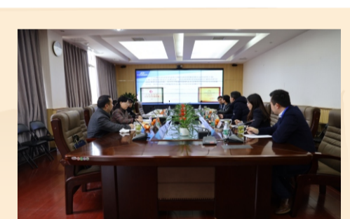
江西省省委统战部副部长、省工商联 党组书记李青华视察发达集团