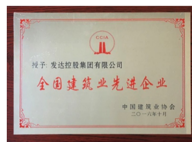
全国建筑业先进企业