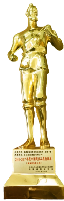
中国建设工程鲁班奖