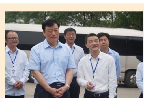
(时任)江西省副书记刘奇 视察发达集团

多年来，发达控股集团在社会各界的支持和关爱下，走过了不平凡的创业发展历程，同时也铸就了发达人精诚合作，奋勇争先的团队精神。发达人在奋斗中历练，在实践中成长。公司发展至今，在各级领导的关怀下，脚步更加坚实，发展更加快速，信心更加坚定!!!