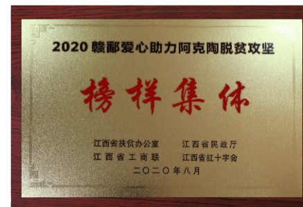
集团助力阿克陶脱贫攻坚捐赠200万元