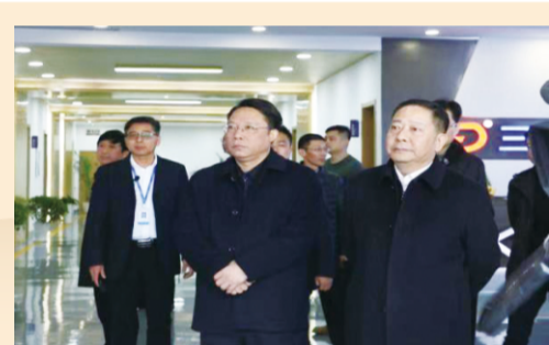
(时任)江西省委常委、南昌市委书记殷美根 (时任)江西省南昌市委副书记、市长刘建洋 视察集团装配式产业园