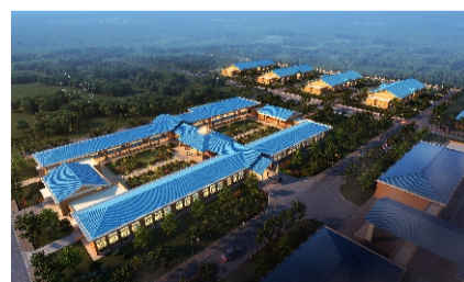
纳米比亚青年培训中心

2017年，发达控股集团走出国门，承建了中国援建纳米比亚青年培训中心二期项目。同年，发达控股集团紧跟国家政策步伐，在南昌市进贤县温圳工业园投资6亿余元建设PC构件装配式生产基地，并于2018年7月正式投产，在江西省率先推进了装配式建筑行业的发展。