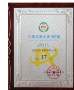
江西民营企业百强17位