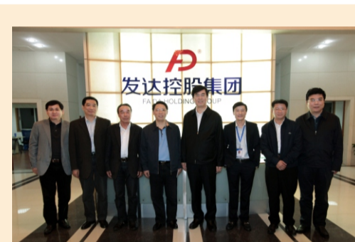
(时任)江西省副省长李炳军 莅临集团调研指导