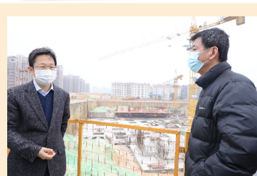
南昌副市长宋宋监督项目复工复产 与集团副总经理徐丰昌亲切交谈