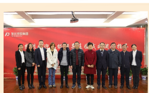
江西证监局局长唐理斌一行 莅临发达集团调研