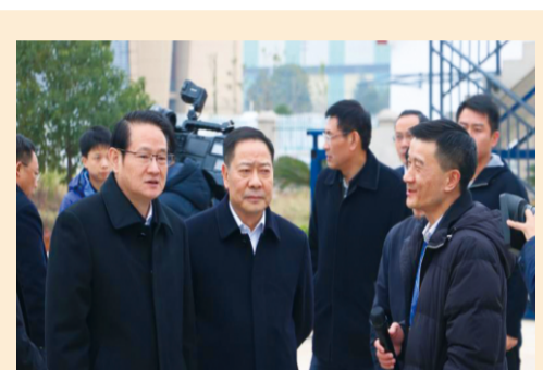
江西省副书记、省长易炼红 莅临集团装配式产业园调研