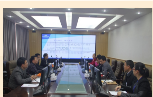
江西省政协副主席、省工商联主席雷元江 一行莅临公司调研