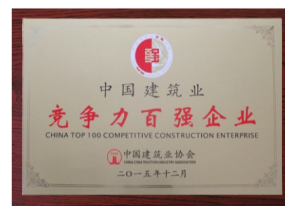
中国建筑业竞争力百强企业