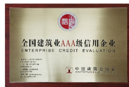
全国建筑业协会AAA信用企业