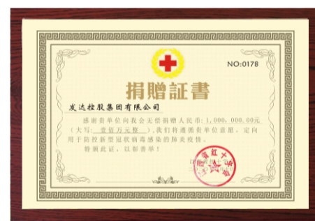
集团向江西省红十字会捐赠100万元