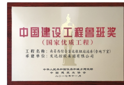
中国建设工程鲁班奖