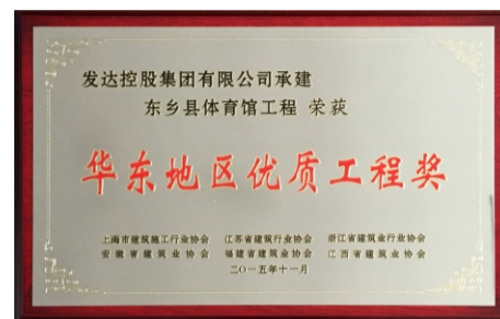
华东地区优质工程奖